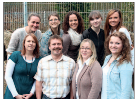
Unsere Abteilung Logistik/Spedition