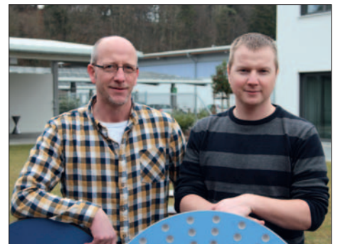
Unser Technischer Kundensupport