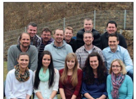
Unser Team Planung & Angebot

Auch in Sachen Gerätewartung und Teileaustausch stehen wir Ihnen jederzeit gerne zur Seite. Jedes Produkt trägt eine Kennzeichnungsplakette zur genauen Geräteidentifikation. Die darauf enthaltenen Informationen ermöglichen eine schnelle Ersatzlieferung aus dem Teilelager oder die exakte Reproduktion eines ausgefallenen Bauteils.