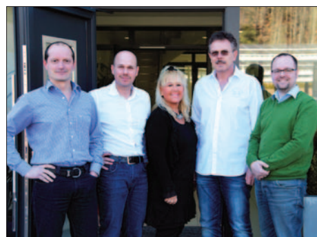
Das Team Geschäftsführung