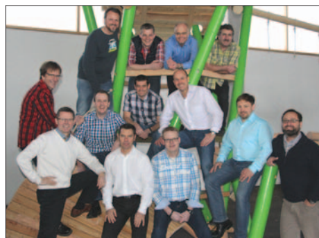
Unsere mobilen Fachberater vor Ort

In unserer Konstruktionsabteilung bekommen unsere Spielplatzgeräte ihre fertigungsgerechte Ausarbeitung in Form von präzisen CAD-Konstruktionszeichnungen. In diesem Arbeitsschritt werden Entwicklungen - soweit notwendig - statisch berechnet und noch einmal auf die Einhaltung aller relevanten Normen geprüft. Im Anschluss entstehen detaillierte Fundamentpläne, Einbau- und Wartungsanleitungen.